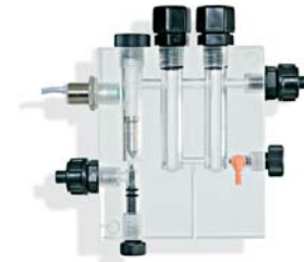
Portaelettrodo doppio pH RX + sensore di prossimità e spurgo aria Double electrode holder pH-RX (ORP) + proximity sensor and manual air bleed