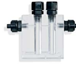
Portaelettrodo doppio Double electrode holder